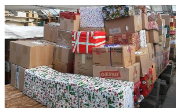
Das Lager voller Weihnachtspakete

Liebe Freunde, Helfer, Spender und Gönner, fast ein Jahr ist schon wieder vergangen seit unserer letzten Weihnachtspaketaktion. Dank Ihrer Mithilfe, Spendenbereitschaft und Ihres Engagements wurde die Aktion, wie auch in den letzten Jahren, wieder ein großer Erfolg. Wir durften zwei Sattelzüge auf die Reise nach Kroatien und Bosnien-Herzegowina in die Orte Vukovar, Vinkovci, Ivankovo und Domanovici schicken. Die Ladungen der zwei Lkws bestanden aus 2.317 großen Paketen und 15 Paletten mit Lebensmitteln, vielen Paketen mit Süßigkeiten und Geschenken für die Kinder in Vukovar, Vinkovci und Ivankovo, 70 Paketen mit Inkontinenzprodukten, 50 Paketen mit Kleidung. Weiterhin lieferten wir Spielsachen, Bettwäsche und Schlafdecken, Hygieneartikeln, Fahrräder, Rollatoren, Krücken, Tische, Stühle und vieles mehr. Insgesamt wurden 32 Tonnen an Hilfsgütern geliefert. Zusätzlich wurden noch 1.000 Euro für die Aktion „Brot und Milch“ für die Kinder in Vukovar, 1.000 Euro für die Aktion „Holz und Kohle“ in Vinkovci und 1.000 Euro für die Verteilung an die Hilfsbedürftigen in Ivankovo unserem Fahrer zur Überbringung übergeben. Eine an Leukämie erkrankte Jugendliche erhielt 500 Euro für teure Medikamente. Pfarrer Korov aus Koska bekam 1.000 Euro für besondere Notfälle und eine schwer erkrankte Person wurde mit 500 Euro für Medikamente unterstützt. Das Seniorenheim in Domanovici erhielt zusätzlich zu den Weihnachtspaketen und Inkontinenzprodukten 1.000 Euro für Lebensmittel und Medikamente.