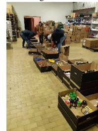
Vinkovci: Ausgabe der Lebensmittel