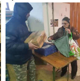
Danke für die Hilfe und Unterstützung von den Bewohnern und Mitarbeitern des Seniorenheims in Domanovici