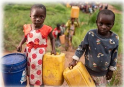
Kinder schleppen Wasser in Kanister