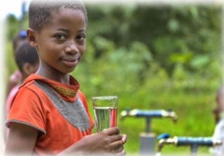
Danke, dass Du hilfst. Der Himmel wird es Dir vergelten.